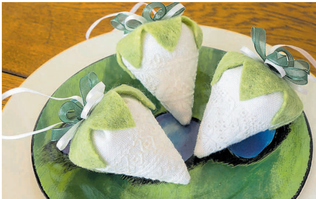
Een voorbeeld van een moderne toepassing van de technieken van Fries witwerk. Foto uit het boek